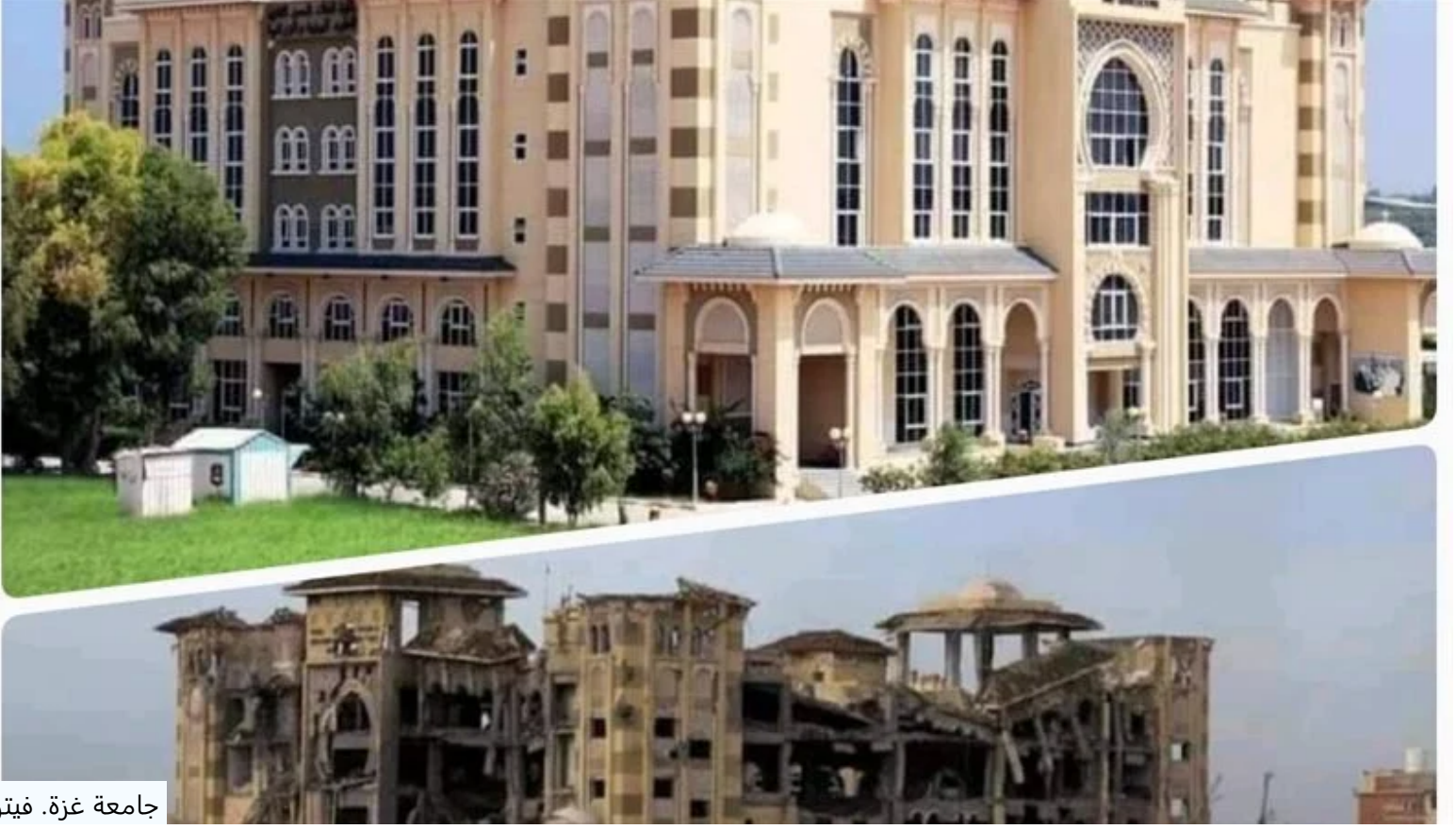
جامعة غزة. فيتو